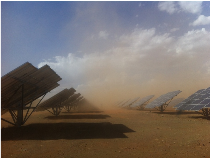
Bild 2: Photovoltaik-Anlage im Wüsteneinsatz (KACO new energy GmbH)

Wie Solarenergie in elektrische Energie umgewandelt werden kann, ist seit langem bekannt, allerdings gelingt dies nur zu einem vergleichsweise geringen Prozentsatz. Etwa ein Fünftel der aufgefangenen Solarenergie kann derzeit in elektrische Energie umgewandelt werden. Außerdem muss der entstandene Solarstrom noch in eine Form umgewandelt werden, die mit dem etablierten Stromversorgungsnetz verträglich ist. Insbesondere bei diesem letzten Schritt geht noch einmal Energie verloren und die elektronischen Bauteile, die für diese Umwandlung benötigt werden, funktionieren nicht besonders zuverlässig unter extremeren klimatischen Bedingungen. Die liegen aber meistens genau da vor, wo die Sonne besonders viel Energie liefert.