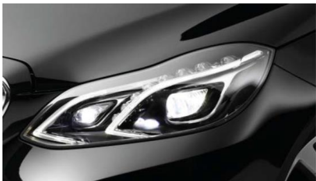
Bild 1: Voll-LED Scheinwerfer mit blendfreiem Fernlicht

Dies Zielereichung soll anhand mit der Fertigung einer Demonstratorkomponente aus dem Automobilbereich nachgewiesen werden. Als Demonstrator ist eine anwendungsnahe, gemäß heutigem Stand der Technik nicht wirtschaftlich im Einschicht-Spritzgießprozess herstellbare, dickwandige Optik vorgesehen. Gleichzeitig sollen die strengen Anforderungen der Automobilbranche bzgl. optischer Performance sowie Umweltbeständigkeit (z. B. UV-Einfluss, Klimabeständigkeit) erfüllt werden. Der vorgesehene Lösungsweg beinhaltet Design, Simulation und Erarbeitung innovativer Optiken unter Ausnützung der neuen Möglichkeiten, die sich durch die Verwendung von Mehrmaterialsystemen und optisch wirksamen Mikrostrukturen ergeben. Zur Einbringung optisch wirksamer Strukturen in Werkzeugoberflächen sollen neue Bearbeitungsstrategien zur Direktbearbeitung von Freiformflächen erforscht werden. Neben numerischen