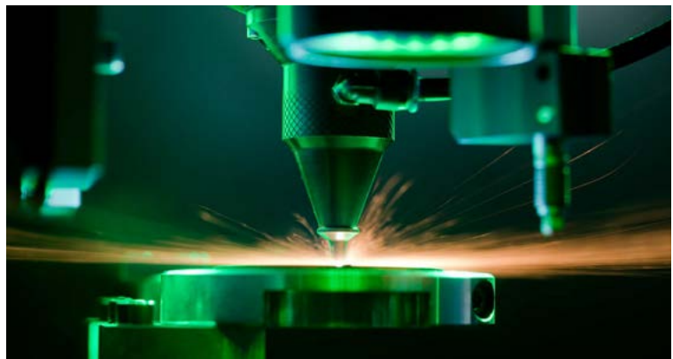
Bild 2: Lasermikromaterialbearbeitung

Wenn die Arbeiten erfolgreich verlaufen, steht der Fertigungsmesstechnik ein neues berührungsloses Geometriemessverfahren zur Verfügung, mit dem sich Objektdaten automatisch im Mikrometerbereich erfassen lassen. Damit ist die automatische Maschineneinrichtung und die kontinuierliche Überwachung von Bearbeitungsprozessen wie u.a. Bohren, Drehen, Fräsen möglich. Das Sensorsystem stellt damit einen wichtigen Baustein bei der Digitalisierung von Bearbeitungsprozessen dar.