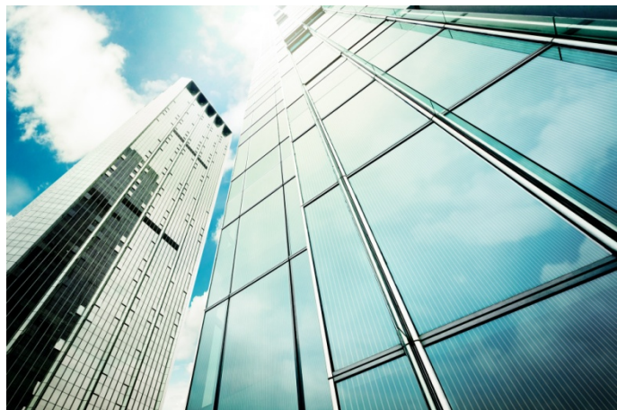
Bild 2: Prinzipdarstellung einer transparenten OPV-Glasfassade.

Mit dimensionierbaren Solar-Folien wird eine einfache und großflächige Integration in VSG-Glas und sogar in gebogene Gläser ermöglicht. Eine Vielzahl von Glasanwendungen im Bereich der Fassade ist transparent oder teiltransparent, auch hier bietet die angestrebte Technologie eine Lösung, denn die Folien können flächig transparent gestaltet werden. Langfristiges Ziel ist die Erreichung einer Transparenz im Bereich von 50% bei maximaler Effizienz. Aktuell