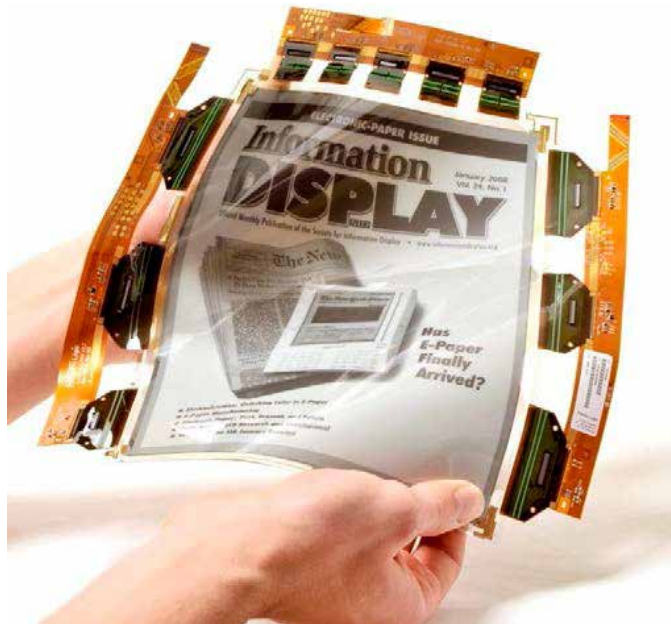
Bild 2: Das weltweit erste kommerziell erhältliche, flexible Display mit OTFT Backplane von Plastic Logic