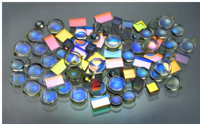
Bild 1: Licht für die verschiedensten Anwendungen maßschneidern – darum geht es in der Fördermaßnahme „Photonik nach Maß“.

Die Bekanntmachung „Photonik nach Maß – Funktionalisierte Materialien und Komponenten für optische Systeme der nächsten Generation“ verfolgt das Ziel, diese Entwicklung zu unterstützen und Unternehmen in Deutschland dazu zubefähigen, die vorhandenen hervorragenden Kompetenzen zu einer anhaltenden, weltweiten Marktführerschaft auszubauen.