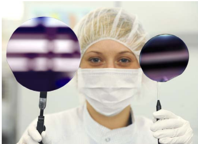
Bild 2: Wafer aus der LED-Fertigung mit 150 bzw. 100 mm Durchmesser

Ultrakurzpulslaser bieten hier das Potential berührungslos deutlich kleinere Schnittbreiten zu erzielen, ohne das Material thermisch zu beeinflussen oder zu verformen. Eine Verkleinerung der Schnittbreite führt durch eine höhere Bauteilanzahl pro Wafer unmittelbar zu einer besseren Materialausnutzung in der Produktion und damit zu einer Effizienzsteigerung bei gleichzeitiger Ressourcenschonung. Neben dem Trennen von Halbleitern bei der Fertigung von LEDs, Solarzellen oder Transistoren ist auch das Schneiden von Refraktärmetallen für die Fertigung von Energiesparlampen eine mögliche Anwendung. Damit erhielt die deutsche Industrie in wichtigen Wachstumsbranchen eine neue Fertigungstechnik, die einen klaren Wettbewerbsvorteil bietet.