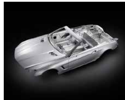
Bild 1: Moderne Leichtbaukonstruktionen erfordern eine Vielzahl innovativer Bearbeitungsverfahren

Der effiziente Umgang mit begrenzten Ressourcen ist eine der großen Herausforderungen unserer Zeit. Vor diesem Hintergrund finden in der Verkehrsindustrie, insbesondere der Automobil- und Luftfahrtindustrie, Leichtbaukonzepte heute schon vielfach Anwendung. Um jedoch einen breiten Einsatz von Leichtbaumaterialien zu erreichen, fehlt es derzeit für eine Vielzahl neuer Materialien noch an geeigneten Bearbeitungs-, Prüf- und Messverfahren, um eine wirtschaftliche, flexible und automatisierte Fertigung in der Großserie umsetzen zu können. Photonische Verfahren bieten hier Lösungen: Die hohe Flexibilität und insbesondere die berührungslose, verschleißfreie Wirkungsweise des Lasers bietet Vorteile für die Bearbeitung von Werkstoffen, deren konventionelle Bearbeitung mit einem hohen Werkzeugverschleiß einhergeht. Die Möglichkeit der lokalen und für die jeweilige Fertigungsanforderung maßgeschneiderten Energieeinbringung eröffnet für die Bearbeitung temperaturempfindlicher Werkstoffe neue Möglichkeiten. Mit der Fördermaßnahme „Photonische Verfahren und Werkzeuge für den ressourceneffizienten Leichtbau“ im Rahmen des Programms „Photonik Forschung Deutschland“ verfolgt das Bundesministerium für Bildung und Forschung (BMBF) das Ziel, bestehende Hemmnisse bei der breiten Einführung von Leichtbaumaterialien in die Großserienfertigung zu überwinden. Für die Forschungsarbeiten in insgesamt 12 Verbundprojekten stellt das BMBF insgesamt knapp 30 Mio. € zur Verfügung.