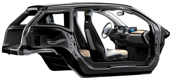
Bild 3: Fahrgastzelle (Life-Modul) des BMW i3 aus kohlenstofffaserverstärktem Kunststoff

Neben den verfahrenstechnischen Entwicklungen werden auch die maschinentechnischen Voraussetzungen, insbesondere hinsichtlich der photonischen Prozesse in Form von Strahlerzeugung, -führung und -ablenkung geschaffen, um die einzelnen Laserverfahren in die industrielle Praxis zu überführen. Auf diese Weise wird der Weg zur größeren Marktdurchdringung der Leichtbautechnik insbesondere für den Automobilbau geebnet.