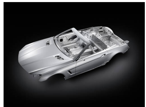
Bild 1: Moderne Leichtbaukonstruktionen erfordern eine Vielzahl innovativer Bearbeitungsverfahren

Mit der Fördermaßnahme „Photonische Verfahren und Werkzeuge für den ressourceneffizienten Leichtbau“ im Rahmen des Programms „Photonik Forschung Deutschland“ verfolgt das Bundesministerium für Bildung und Forschung (BMBF) das Ziel, bestehende Hemmnisse bei der breiten Einführung von Leichtbaumaterialien in die Großserienfertigung zu überwinden. Für die Forschungsarbeiten in insgesamt 12 Verbundprojekten stellt das BMBF insgesamt knapp 30 Millionen Euro zur Verfügung.