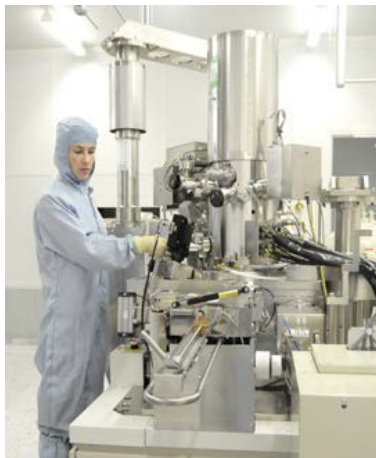
Bild 2: Herstellung von Halbleiternanosstrukturen mittels Elektronenstrahlolithographie

Im Projekt HISens haben sich die nanoplus Nanosystems and Technologies GmbH und die Universität Würzburg mit dem Endanwender Endress+Hauser zusammengeschlossen, um hochsensitive Infrarotsensoren für den mittleren Infrarotbereich zu konzipieren und zu erforschen. Innerhalb der letzten Jahre wurden im Bereich der optischen Gas-Sensorik enorme Fortschritte im Bereich der Lichtquellen durch sogenannte Interbandkaskadenlasern (ICL) erzielt. Dem gegenüber stehen allerdings nur vergleichsweise geringe technologische Fortschritte im Bereich geeigneter Detektoren, die im entsprechenden Gesamtsystem der optischen (Gas-)Sensorik aktuell das limitierende Element darstellen.