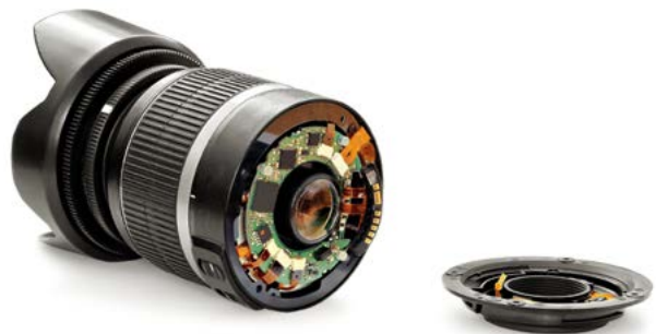
Bild 1: Die Digitalisierung erlaubt eine weit engere Verbindung zwischen optischen, elektronischen und mechanischen Funktionsebenen, als dies bislang der Fall war, hier am Beispiel eines Objektivs.

Die Optischen Technologien erfahren durch die Digitalisierung einen bedeutenden Wandel. Beispielsweise liefern optische Messsysteme heute dank moderner elektronischer Unterstützung wesentlich umfangreichere und präzisere Informationen, da weit aufwändigere Auswertungsalgorithmen verwendet werden können, als noch vor wenigen Jahren. Die Photonik ist jedoch nicht nur Nutzer, sondern auch ein wesentlicher Treiber der Digitalisierung. Die Datenerfassung mit optoelektronischen Sensoren, die optische Informationsübertragung und schließlich die Darstellung von Information bedürfen modernster optischer Technologien, ohne die unsere digitalisierte Welt nicht vorstellbar wäre.