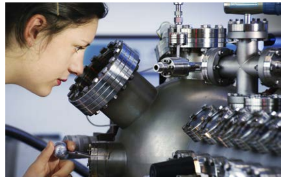
Bild 1: Neue optische Effekte erfordern zu ihrer erstmaligen Beobachtung regelmäßig einen weit höheren Aufwand, als er für eine praktische Anwendung vertretbar wäre.

Die Projekte der Bekanntmachung „Photonik Plus – Neue optische Basistechnologien“ haben zum Ziel, Arbeiten zu solchen Erkenntnissen der optischen Grundlagenforschung zu unterstützen, die bisher nicht oder nur unterkritisch für eine praktische Anwendung erschlossen werden konnten.