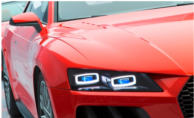
Bild 1: Zukunftsvision: Adaptiver Laserscheinwerfer zur Verbesserung der Verkehrssicherheit bei Nacht (Quelle: Audi AG).

Die LED Technologie ist ein sich rasant entwickelndes Forschungsfeld. In den letzten Jahren konnten Effizienzen um ein Vielfaches gesteigert und die Lichtqualität stark verbessert werden. Die LED hat sich von einer schwach glimmenden Signalleuchte zu einer leistungsstarken Lichtquelle entwickelt, die sich immer neue Märkte und Anwendungsfelder, bis hin zur Automobil- und Allgemeinbeleuchtung erschließt. Insbesondere auch deutsche Firmen konnten sich hier durch intensive Forschungsanstrengungen international einen Technologievorsprung und entsprechende Marktanteile sichern. Gleiches gilt auch für andere Halbleiterlichtquellen, wie Diodenlaser oder OLEDs.