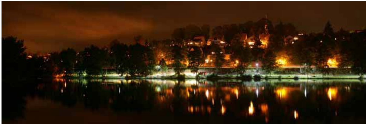
Bild 2: LED-Teststraße im Naturschutzgebiet St. Georgen bei Nacht

Die großflächige Einführung von LED Beleuchtung in einer für Deutschland typischen Kommunalstruktur, bestehend aus einem Oberzentrum, einem Unterzentrum, einem Kleinzentrum und einer Gemeinde, soll demonstriert, getestet und evaluiert werden. Dabei wird berücksichtigt, dass die Beleuchtungsanforderungen der beteiligten Kommunen in ähnlichen Gebieten nahezu identisch sind. Somit lassen sich mehrere Beleuchtungssituationen identifizieren und charakterisieren, die Demonstrationscharakter für andere Kommunen besitzen.