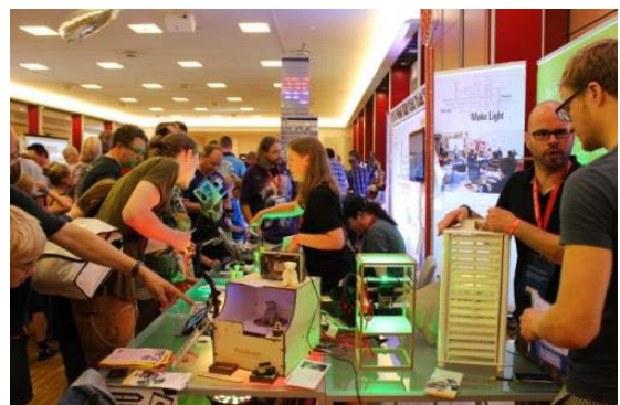
Bild 1: Offene, frei verfügbare Hardware bildet die Basis der Maker-Bewegung und ermöglicht die unmittelbare Beteiligung am Innovationsprozess

Mit der Fördermaßnahme „Open Photonik“ möchte das Bundesministerium für Bildung und Forschung (BMBF) neue Formen der Zusammenarbeit von Wissenschaft und Wirtschaft mit Bürgern ermöglichen und damit zusätzliche In-